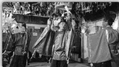
神迎いの儀式である場清めの舞で、大元神楽の全ての舞の基本動作が含まれている