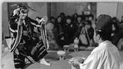
山からの来訪神を里人がもてなす舞で、言葉のやり取りで笑いを誘う