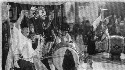
楽器だけで演じられ、全ての神楽囃子の要素が含まれている