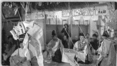
大元神楽の中心行事の一つで、三人の曳き手が吊るされた九つの天蓋を操る