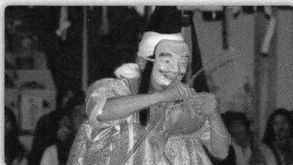
蛭子と神主の歌の掛け合いや連れ舞、鯛釣りを行う縁起の良い舞