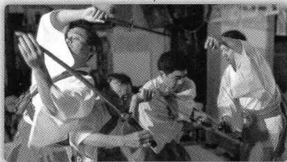
剣を持って災いを払う舞で、四人が輪になり、跳び、くぐる、という技が見所