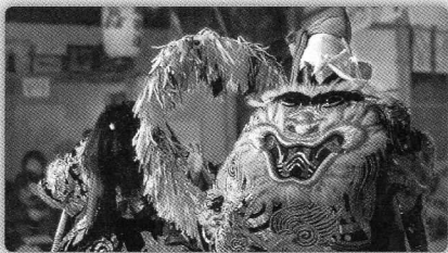
神が鬼を退治する舞で、神は風格を、鬼は重厚に舞うことが大切とされる