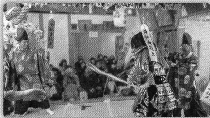
神懸りの前に必ず舞われる舞で、所領争いの神話を題材にしている