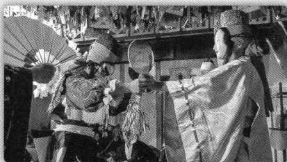
天の磐戸開きの神話を題材にした舞